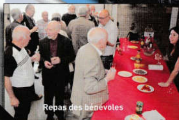
Repas des bénévoles