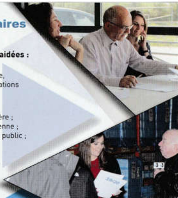
France3 et la BA